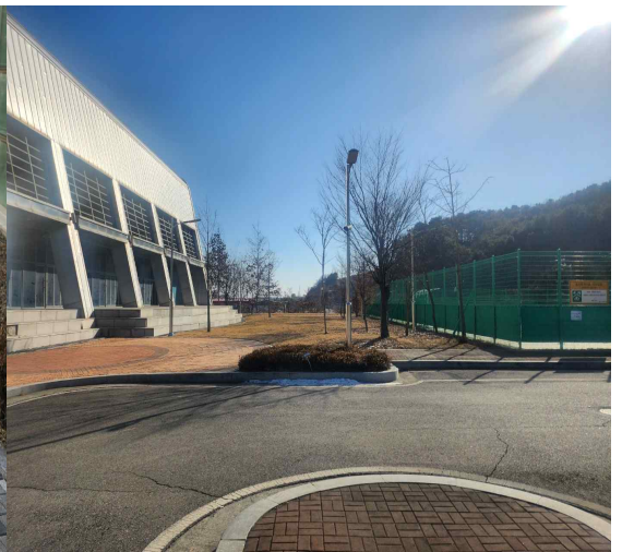
월롱 100주년 기념체육관